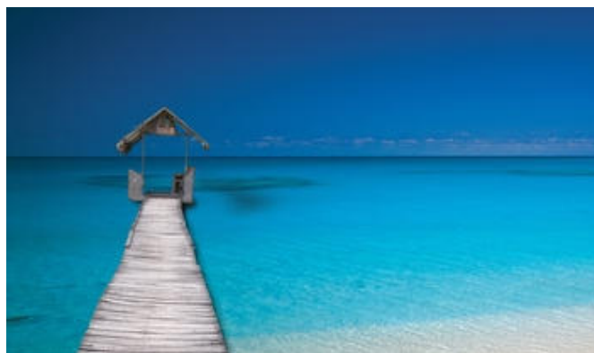
Changer de perspectives et de modes de pensée...

– Si, répondit le Maître, mais cela dépend de quel animal je décide de nourrir.