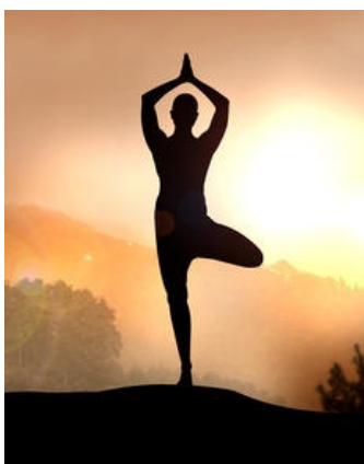
Au contact de ma nature...

C omme tous les jours, les disciples allèrent trouver leur maître pour leur leçon. Quand ils arrivèrent, ils le surprisent en pleine méditation. Au bout d'un moment, le plus hardi se osa à l'interrompre :